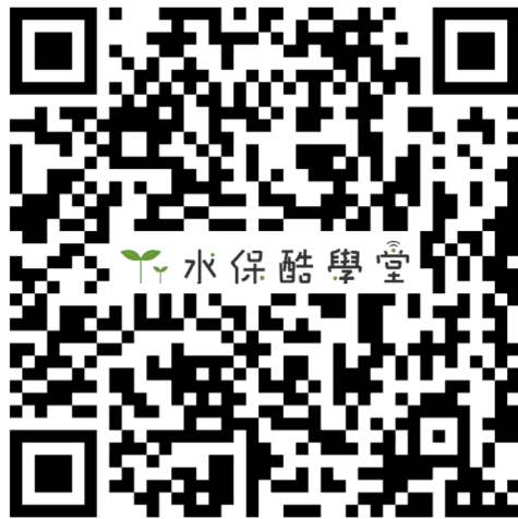
（水保酷學堂網址 QR Code）